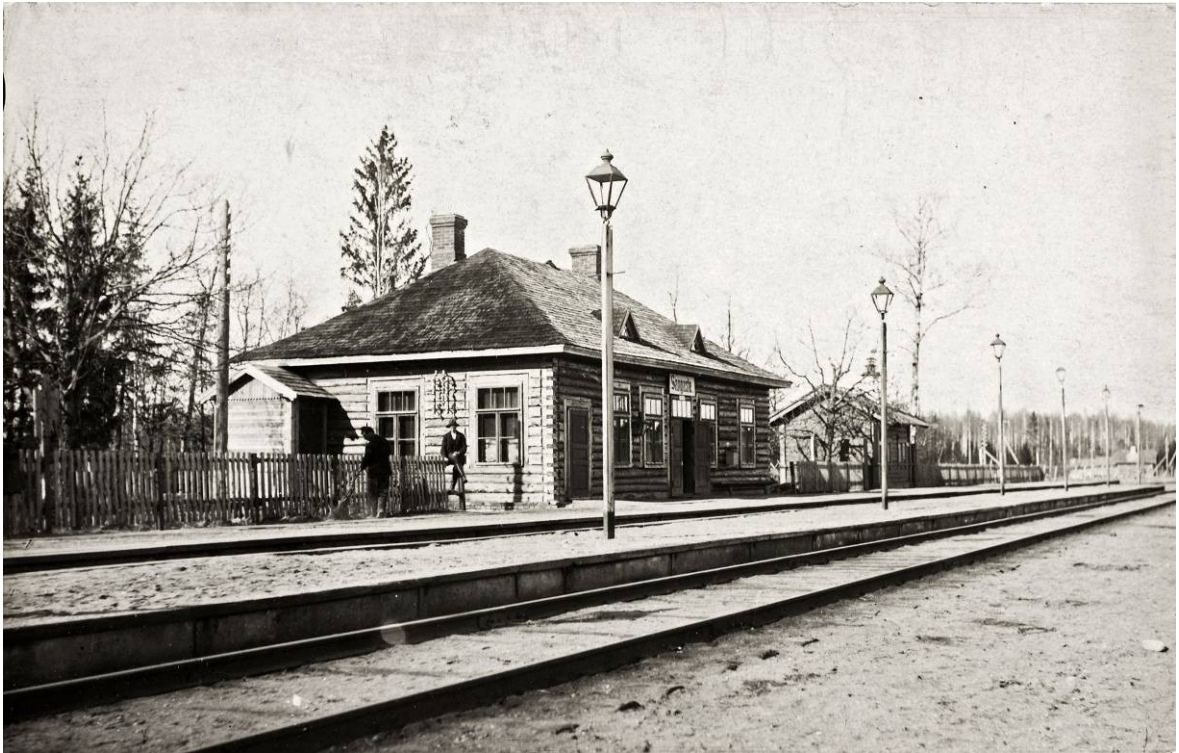
Foto 1. Sangaste raudteejaam 1923. aastal. Fotograaf K. Kalamees. – ERM Fk 461:233.