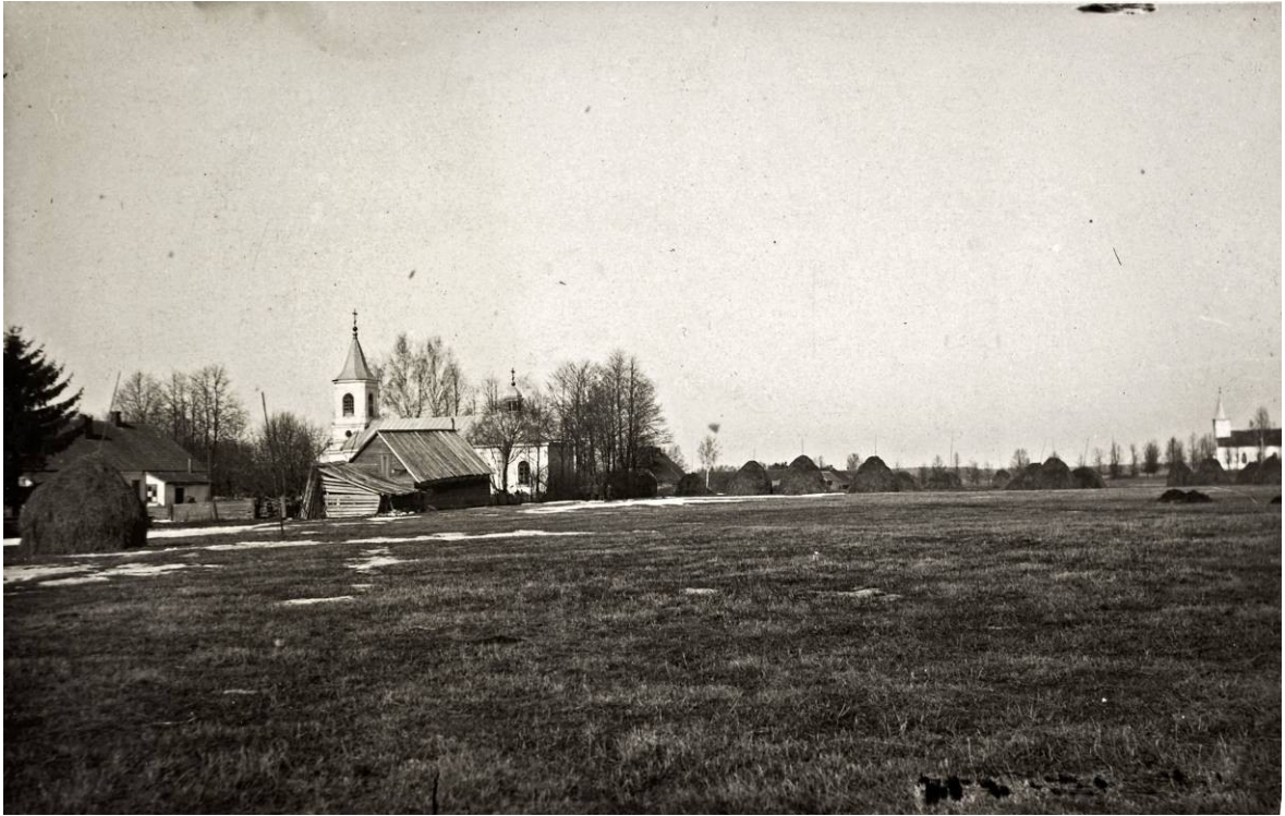
Foto 3. Laatre õigeusu kirik (dateerimata). Fotograaf K. Kalamees. – ERM Fk 461:244.