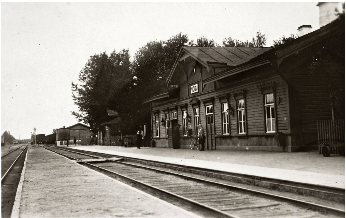
Foto 2. Võru jaamahoone (dateerimata).