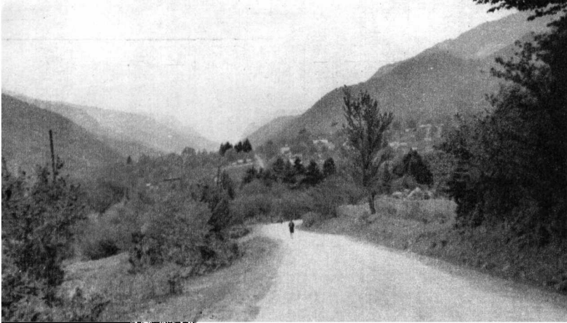
Tee viib Esto-Sadokki.