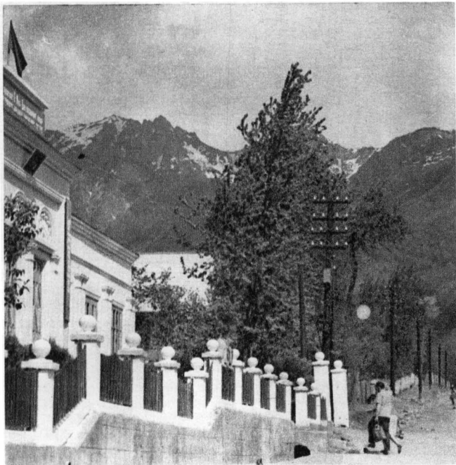
Vaade Punasele Lagedale.