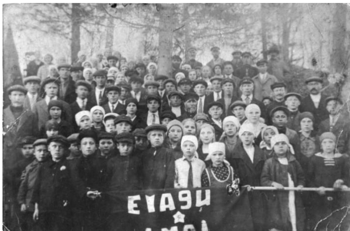
Празднование 1-го Мая в Новозостонске

А вот что районная газета «Окуловский коммунар» накануне войны писала о колхозе: