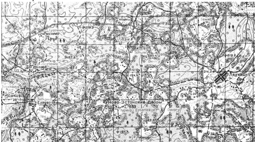
Ново-Эстонские дворы (хутора) на карте О-36-54-D

землю уже выкупила (ГАНО, ф.Р-265, оп.2, д.766, л.34-40).