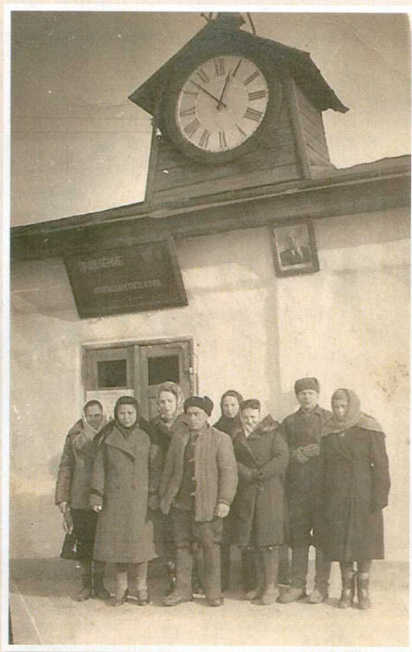
Жители села Новоурупского около здания правления колхоза III Интернационала.