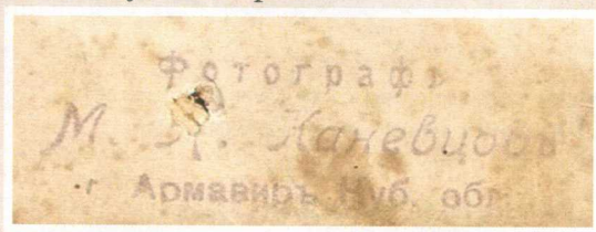
Обратная сторона фотографии (фрагмент)