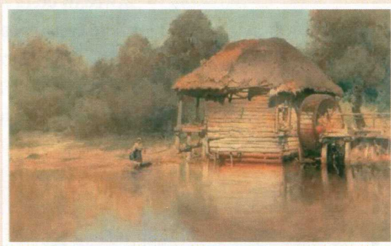
Водяная мельница в начале XX века. Картина.