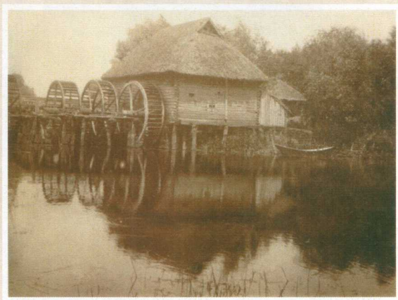
Водяная мельница. Фото 1910 г.

Суточная – 120 пудов, Годовая – 25 000 пудов. Построена в 1924 г.