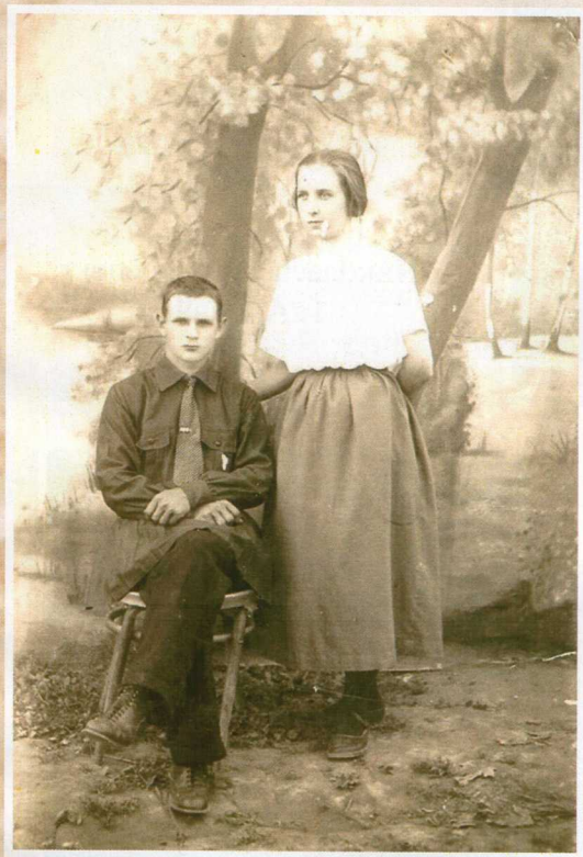
Супруги Верник из села Ливонского. Фото прим. 1920-22 гг.